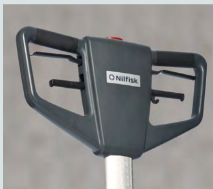
Ergonomiskt handtag med mjuka underkanter för ökad komfort, enklare användning och mindre belastning vid långa arbetspass.