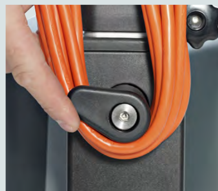
Kabelkroken gör det lätt att plocka av sladden.