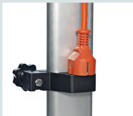
Hållare för elkontakten.