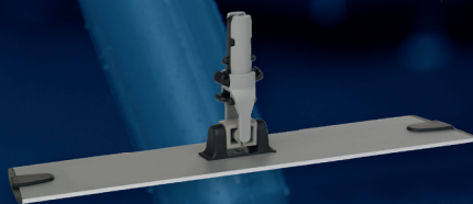
1 x 370400, Superior moppstativ, kardborre, 40 cm