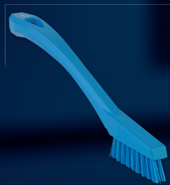
1 x 44013, Detaljborste