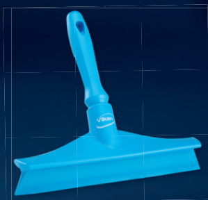
1 x 71253, Ultrahygienisk Handskrapa