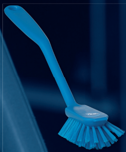
1 x 42373, Diskborste