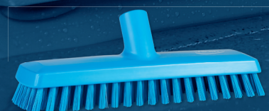
1 x 70413, Golvskrubb m/vattengenomlöpfung