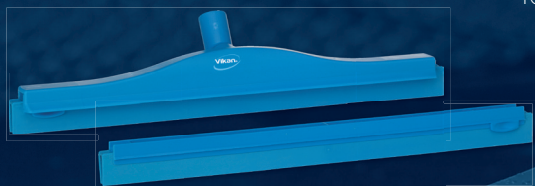
1 x 77233, Hygien Skrapa m/utbyteskassett & vridbar led, 500 mm